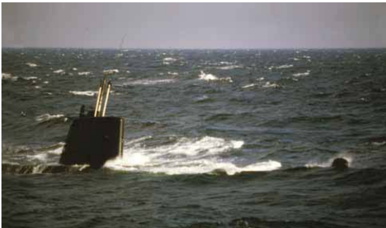
DELFINEN i hårdt vejr.

der ikke flere problemer med moralen om bord – bortset fra en enkel episode, som vil blive behandlet senere.