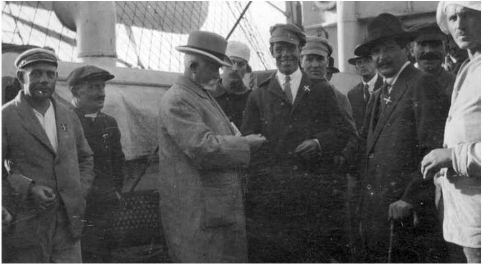
Ved Helsingør kom den sønderjyske komitee om bord. Komiteen uddeler flag og cigaretter.